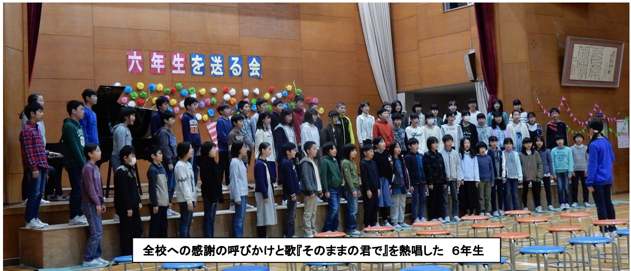
全校への感謝の呼びかけと歌『そのままの君で』を熱唱した 6年生