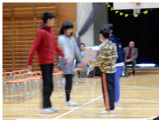
6年生からプレゼント