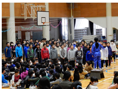
短歌と歌「スマイル」 4年生