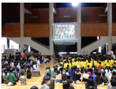
思い出のスライドショーと決意表明の呼びかけ 5年生