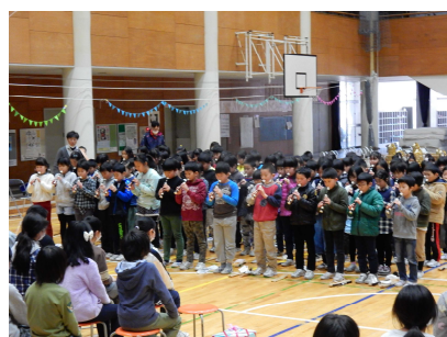
リコーダー演奏 3年生