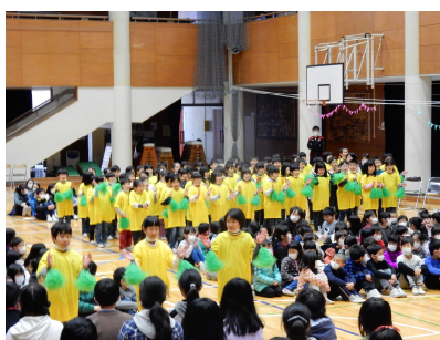
コリンコ音頭でお祝い 2年生