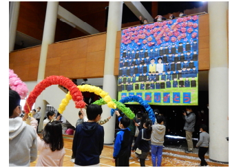
紙吹雪の中を退場