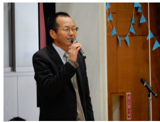
校長先生から感謝の言葉