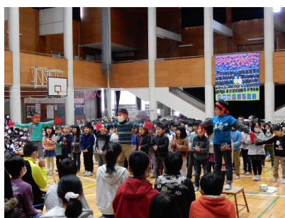
6年生にエール 1年生