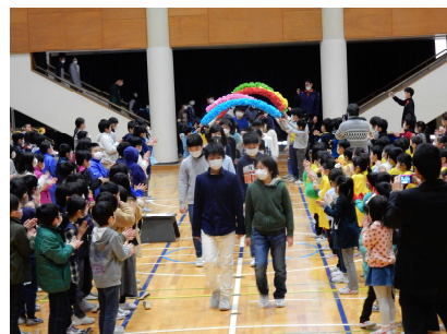
金管バンドの演奏で入場