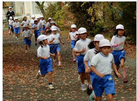
はじめての大会 1年生

15日・16日とマラソン大会がありました。子ども達は友だちや先生・お家の方々が応援してくれる声援を力に変え、自分で決めた目標に向けて精一杯走ることができました。毎朝登校すると専用コースを走ったり大会に向けて走り込みをしたりしてきたので、体力も走力もかなり高まったと思います。自分に『挑戦』できた大会でした。