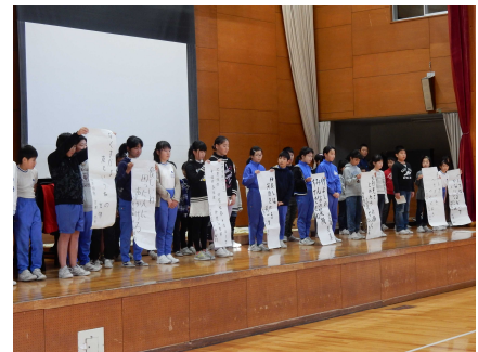
なかよし標語の発表