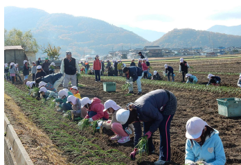
来年の収穫が楽しみ