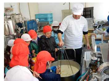
おいしい豆腐に感激