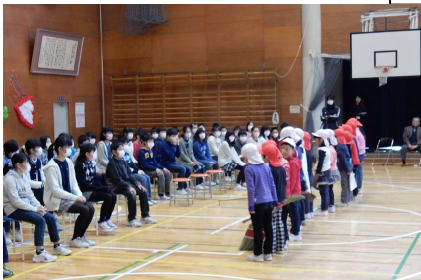
掃除や屋代レンジャーの発表 1年生