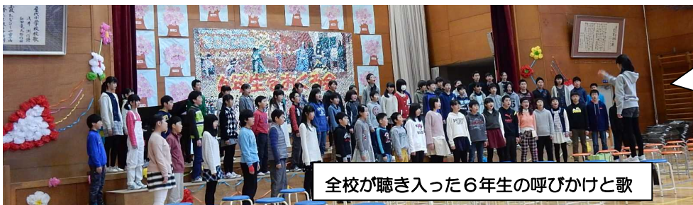
全校が聴き入った6年生の呼びかけと歌

中学に行っても屋代小学校の卒業生として頑張ります。私達が大切にしてきた男女仲良くということを受け継いでいってください。