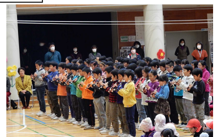
6年生ベスト3とリコーダー 3年生