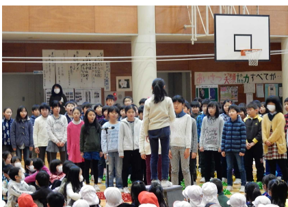
ラッソゴレイと歌「大切なもの」4年生