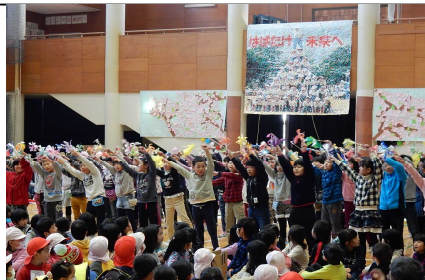
ありがとうの花 2年生