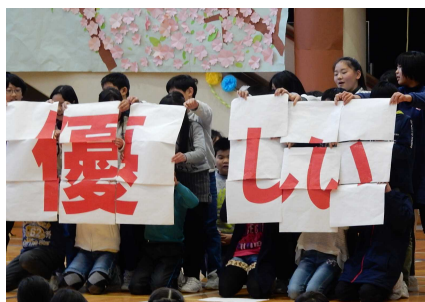
最後を締めた5年生。6年生を「優しい」「元気」「頼れる」と感謝