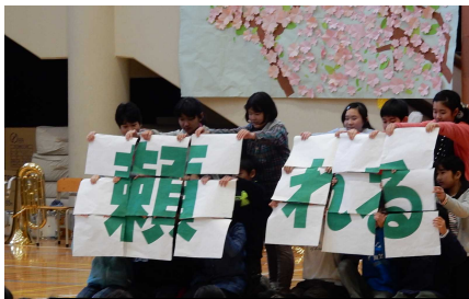
私たちに任せてくださいと力強く宣言。歌「変わらないもの」を発表