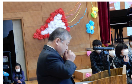
校長先生からピリートの演奏