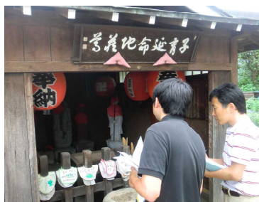
子育て延命地蔵尊 川中島の合戦での戦死者を葬った。今は子どもの健やかな成長を願ってヨダレカケを奉納している。