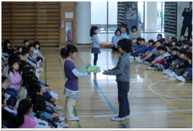
2年生は、けん玉・なわとびを発表した後に、昨年度育てたあさがおの種を1年生にプレゼント。