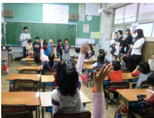
初めての授業参観で張り切る1年生

たくさんの保護者の皆様に参観していただきありがとうございました。「今日は参観日だ」と言って、はりきっている子どもたちもたくさんいました。お家の方に見ていただくことが、大きな励みになっていると感じます。体育館で行われた校長講話の中では、 「家庭学習の手引き」を中心にした自主学