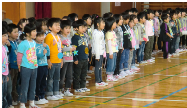
お礼の気持ちを込めて「呼びかけ」と「歌」を元気いっぱいに発表する1年生。