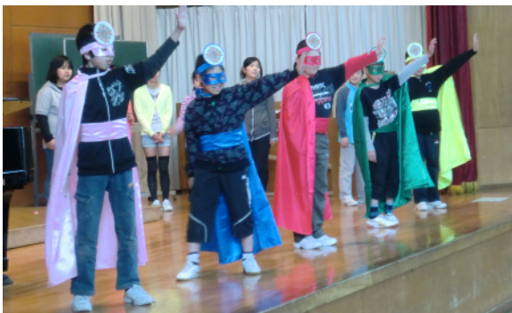
屋代小学校の学校教育目標「あかるくあいさつをする・だれともなかよくする・ものを大事にする・最後までがんばる・本気で勉強をする」を教える、正義のみかた、屋代レンジャー。