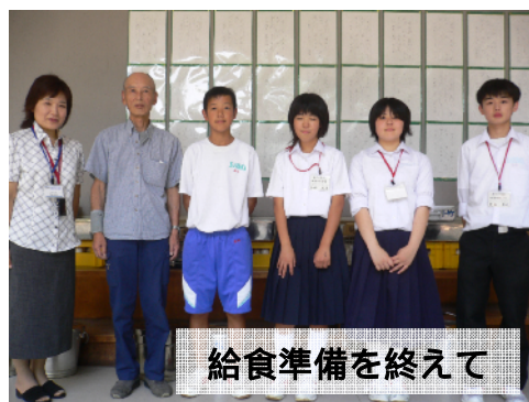
給食準備を終えて

職場体験学習（7/7～9）のため、屋代中2年生の4名の皆さんが、2・3年で学校での仕事を体験しています。教師への夢を膨らませてください。