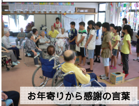
お年寄りから感謝の言葉

ふれあい委員会とさざなみ荘の方々との交流（7/5）が行われました。交流の中で、お年寄りの笑顔に、子どもたちも喜びと元気をもらいました。