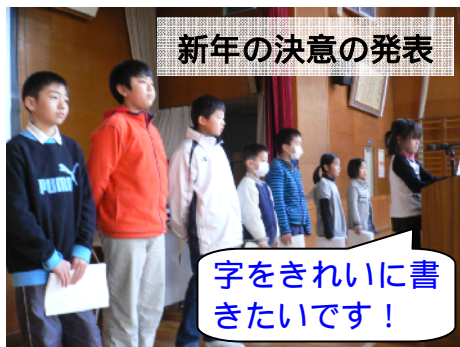
新年の決意の発表