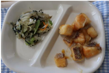
宇和島産真鯛のみかんソースがらめ

千曲市の姉妹都市愛媛県宇和島市の名産「真鯛」が給食に登場しました。例年だと、6年生が、宇和島市の6年生と交流をしていますが、今年は、新型コロナウイルス感染症があり、おこなうことができませんでした。