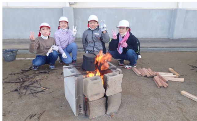
10月30日 5年生デイキャンプ