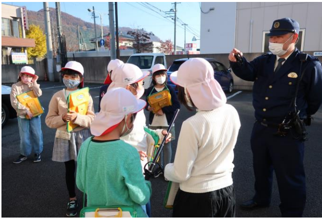
11月17日 4年生千曲警察署見学