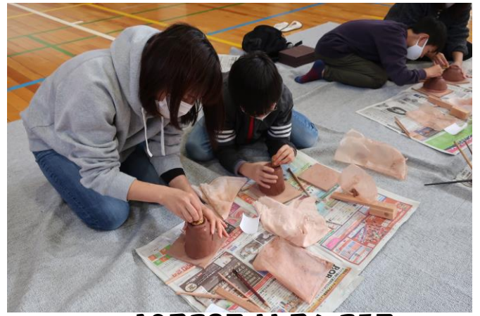
10月28日 11月6・25日 6年生親子体験学習 松代焼制作