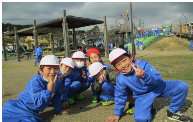
10月29日 2年生生活科遠足

社会見学や学年行事等があるとき、子どもたちの表情が輝きます。様々な体験学習を通して、いつもとは違う見方、考え方ができたり、人と人とのつながりがもてたり、互いのよさをあらためて感じたりすることができます。学校、学年行事に関しては、コロナ禍ではありますが、感染症警戒レベルに配慮しながら、感染対策に努め、おこなっていきたいと考えています。