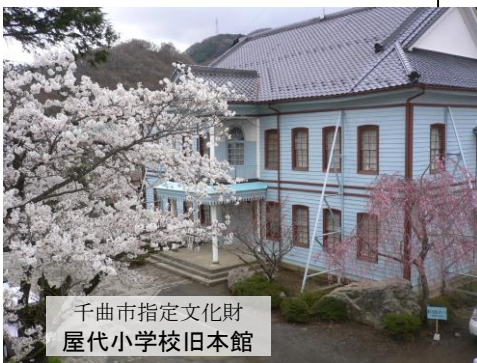
千曲市指定文化財 屋代小学校旧本館

明治21年 現在地に校舎が完成する(就学率:男子53% 女子19%)。 24年 屋代子守学校が設置される。 大正2年 学校林が設けられ杉苗750本を植え込む。 3年 中埴地区8校連合運動会において優勝し、一重山にて全校祝賀会を行う。 7年 補習時間が各町内で盛んに行われる。 10年 就学率ほぼ100%(男女とも)になる。 昭和19年 東京から学童疎開を受け入れる(20.11.12 帰還式)。 勤労奉仕が盛んになり、千曲川原の開墾が行われる。 38年 『沿革史 屋代学校』を発刊する。 40年 松代地震のため、講堂・渡り廊下の屋根の葺き替えをし、グラウンドにプレハブ校舎を設ける。 48年 創立100周年記念式典が行われ、『沿革史屋代学校二』および『屋代百年のあゆみ』が発行される。 54年 校舎全面改築を行う。 旧校舎本館が市指定文化財となり、現在位置に移築保存。 57年 プールが改築される。 61年 校庭全面改修される。 平成5年 開校120周年記念行事が行われ、「記念誌」を発行する。 10年 地域に開かれた屋代小学校を目指し「学校公開参観日」が実施される。 11年 屋代小学校ことばの通級教室が開設される。 17年 体育館に身障者用トイレが設置される。 22年 耐震補強・大規模工事(外壁・屋根・トイレ改修)が行われる。 23年 プール改修工事が行われる。 25年 開校140周年記念に航空写真を撮影。 27年 体育館天井屋根落下防止工事が行われる。