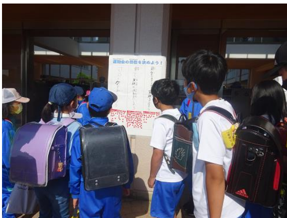
(玄関前の投票の様子)