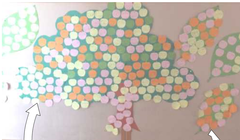
【多くの“実”をつけた“なかよしの木”】

11月は“なかよし月間”として、さまざまな活動に取り組んできました。その一つに“なかよしの木”があります。これは、友だちにしてもらってうれしかったことや友だちのよい姿を“実”にします。どの学年もなかよしの木”にたくさんの“実”がなりました。