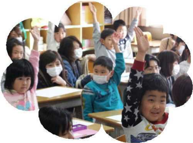
【元気に手を挙げる1年生】

どもたちが暴力から身を守るために、①子どもたちの人権意識を高める(「安心」「自信」「自由」の3つの権利を持っている)、年齢や発達に合わせて正しい知識を提供する、③孤立を防ぐ(家庭・学校・地域がつながっていること)の3つが大切であること、ワークショップを通して、子どもと接するとき心がけたいことを学びました。保護者の方からは、「子どもへ向き合う自分の姿を見返すことができた。子どもが何でも話せるように向かい合いたい」「一日に一度、抱きしめて安心できるようにしたい」といった声が寄せられました。