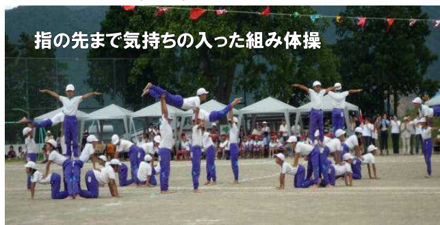
指の先まで気持ちの入った組み体操

暑さ対策のため毎日水筒も持たせていただいたり、泥だらけの運動着を毎日洗濯していただいたりした保護者の皆様。まわりで見守っていただいたり、当日は応援に来てくださったりした地域の皆様。ご協力ありがとうございました。