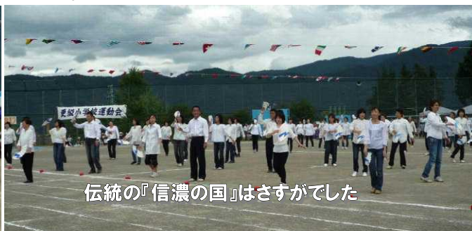
伝統の『信濃の国』はさすがでした