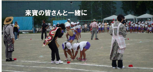
来賓の皆さんと一緒に