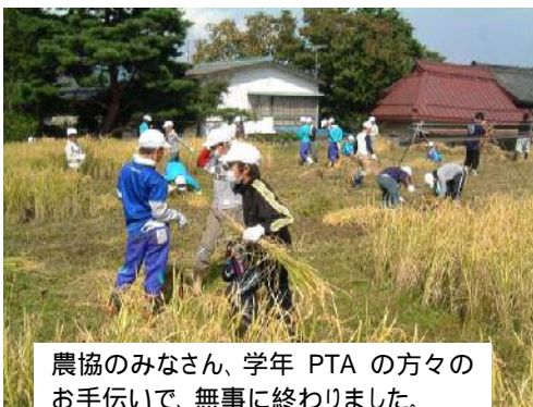
農協のみなさん、学年PTAの方々のお手伝いで、無事に終わりました。