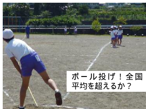
ボール投げ！全国平均を超えるか？

全国の小学校を対象にした「体力・運動能力調査」の対象校になり、1年から6年まで全員が体力テストに挑戦しました。シャトルラン、反復横と飛び、ボール投げ、握力など、瞬発力、持久力、筋力など丸一日近くかかるメニューに挑戦しました。横飛びの動きがまねできない児童など、いろいろな身体の動かし方ができない子が増えて来たといえます。昨年までの結果では女子のソフトボール投げは、全国平均を超えています。これは、育成会スポーツ大会の効果ではと、話題になっています。結果はまた、ご報告いたします。