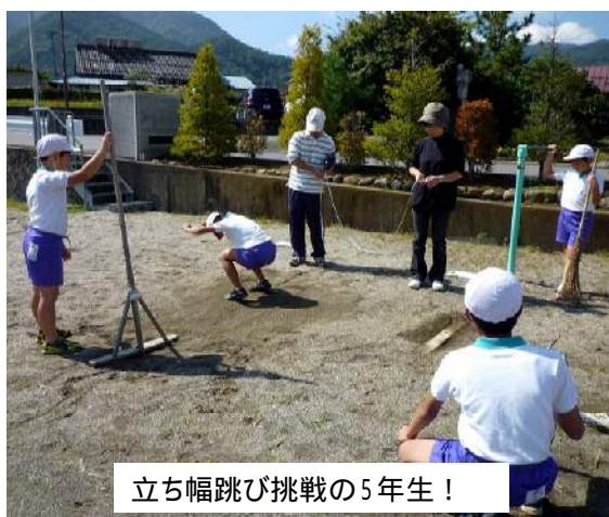
立ち幅跳び挑戦の5年生！

全国の小学校を対象にした「体力・運動能力調査」の対象校になり、1年から6年まで全員が体力テストに挑戦しました。シャトルラン、反復横と飛び、ボール投げ、握力など、瞬発力、持久力、筋力など丸一日近くかかるメニューに挑戦しました。横飛びの動きがまねできない児童など、いろいろな身体の動かし方ができない子が増えて来たといえます。昨年までの結果では女子のソフトボール投げは、全国平均を超えています。これは、育成会スポーツ大会の効果ではと、話題になっています。結果はまた、ご報告いたします。