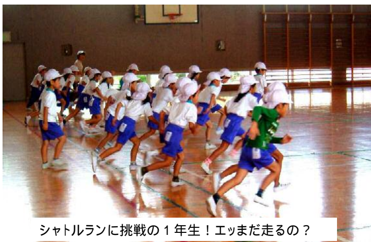
シャトルランに挑戦の1年生！エッまだ走るの？