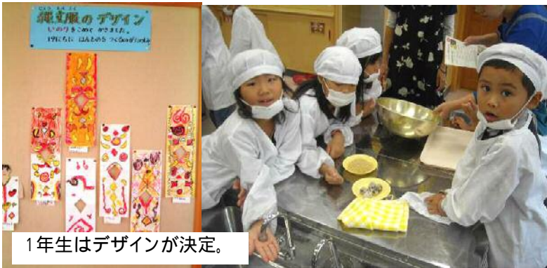
1年生はデザインが決定。