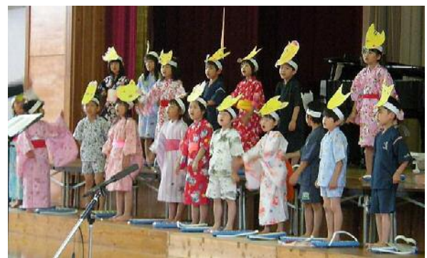
「ここんぱいぱい」こんなに歌姫を覚えられる一年生にビックリ。