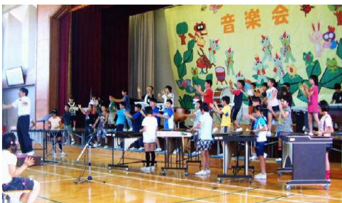
そして、会衆シーンとさせた音楽物語「ごんぎつね」。 少人数でも堂々と歌う姿がすごい5年生