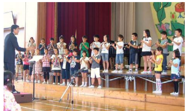
タンギングで美しい音色の「少年時代」は4年生