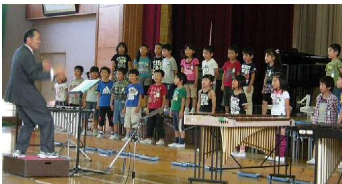
聖者の行進が「オッとあぶないよ！」に変身の2年生 元気いっぱい。