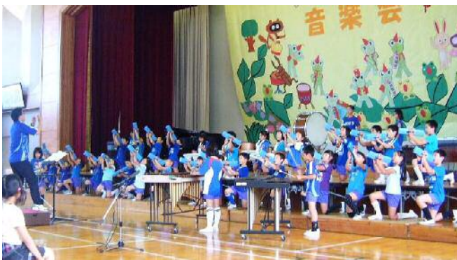
サムライブルーで演奏した！イナズマイレブンのテーマ！決まった3年生 ジャズに挑戦「インザムード」。