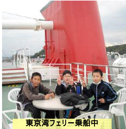
東京湾フェリー乗船中