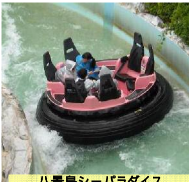
八景島シーパラダイス カッパを用意して乗りました。