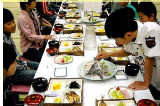
獲った魚が食卓に えっ! まだ生きてる。

フェリーや海底トンネルを使って東京湾を一周する大旅行でした。初日に高速が事故通行止めというハプニングがありましたが、業者の方の機転もあって二日目のルートと入れ替えフェリーで千葉富津の宿に無事到着しました。朝は早く起きて地引き網体験、小雨もその時は止んでクロダイやイカの大漁?でした。でも一番の楽しみは遊園地だったようです。礼儀正しく、集合もいつも確実で、バスガイドさんにも誉められる立派な集団行動でした。