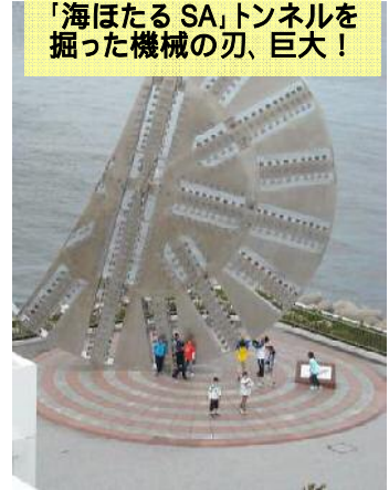
「海ほたる SA」トンネルを掘った機械の刃、巨大!