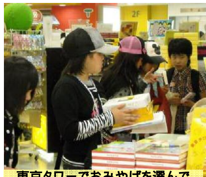
東京タワーでおみやげを選んで