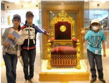
国会、明治天皇の席の椅子