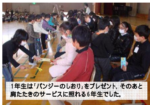
1年生は「パンジーのしおり」をプレゼント、そのあと肩たたきのサービスに照れる6年生でした。