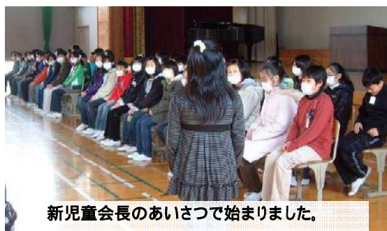
新児童会長のあいさつで始まりました。

先週 11 日は「6年生を送る会」でした。4年生までの各学年は歌やメッセージをプレゼント、5年生は計画・進行の一切を取り仕切って、12月に6年生から引き継いだ鼓笛演奏の発表があります。5年生にとって「もう私たちにまかせて大丈夫ですよ。」という姿を示す会であり、6年生からは「それでは後をよろしく。がんばってね。」のメッセージをもらう行事に今年もなりました。