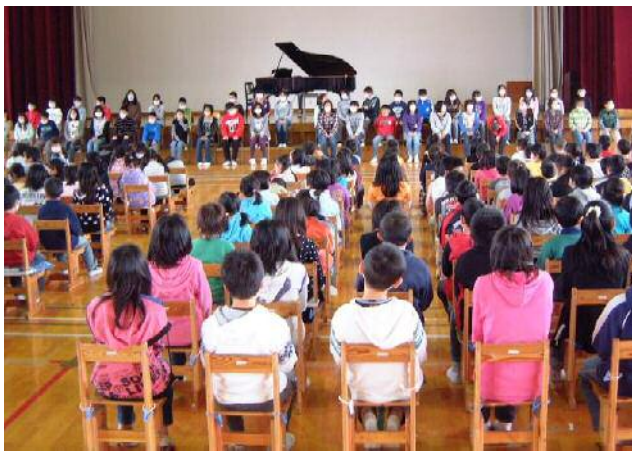
参加の皆様に見ていただきたいと思います。

卒業式に向け今週から全校がそろっての式練習が始まりました。今年の卒業式はご覧のように、卒業生はずっと会場に顔を向けた形で行う予定です。今も6年生のすばらしい歌声が聞こえていました。晴れの姿、立派に見送る姿をご