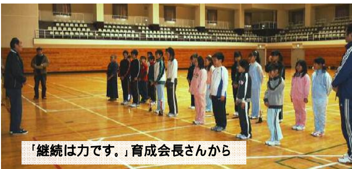
「継続は力です。」育成会長さんから