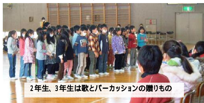
2年生、3年生は歌とパーカッションの贈りもの

3学期中ずっと朝や休み時間も練習する人がいた5年生の鼓笛の演奏は見事でした。「ものすごく上手になってビックリ、これなら任せられると思いました。」と感想をよせた6年生は、卒業式の歌とは別に練習した合唱「Best Friend (ベストフレンド)」を指揮・伴奏も自分たちで演奏しました。これも気持ちが伝わる発表でした。そして、6年生がひもを引くと恒例のくす玉が見事に割れて、大成功の会になりました。