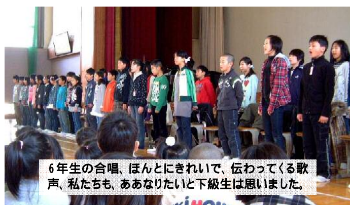
6年生の合唱、ほんとにきれいで、伝わってくる歌声、私たちも、あなりたいと下級生は思いました。