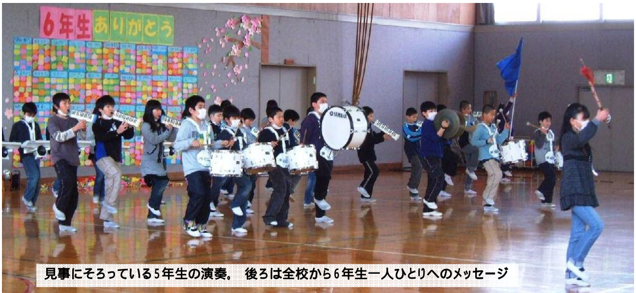
見事にそろっている5年生の演奏。後ろは全校から6年生一人ひとりへのメッセージ