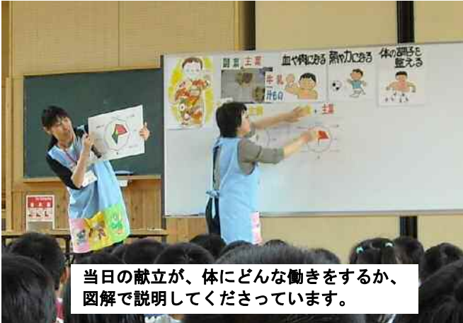
当日の献立が、体にどんな働きをするか、図解で説明してくださっています。

児童集会7/3 には「 ノコシマセンジャー 」が登場。給食委員の4年生も大活躍。3色のコスプレで3つの栄養素の復習をしました。残食が少ない学級が委員長より表彰を受けました。