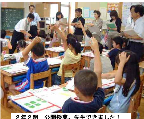
2年2組 公開授業。先生できました！ 手がたくさんあがっています。