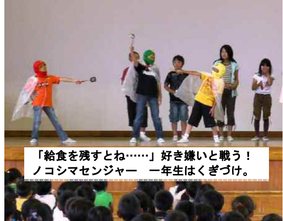
「給食を残すとね……」好き嫌いと戦う！ ノコシマセンジャー 一年生はくぎづけ。