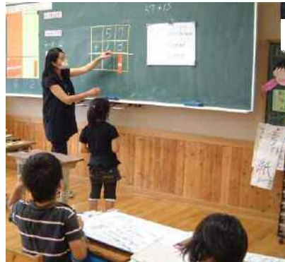
ホワイトボードにやり方メモ 2年生