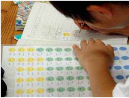
ノートに理解度マークを貼る。5年生

今年は7月と11月に、東京大学大学院の先生をお招きして、「算数授業」の指導をしていただき、私たちの授業力のスキルアップをめざしています。その意味もあって、参観日の1時間は全校で「算数」としました。機械的に計算する力をつけるだけでなく、計算の仕方の意味を自分のことばで説明したり、予習をしてきて、授業後に自分の理解度をチェックしたり、と先生方各自が様々な工夫をしている様子を見ていただきました。アンケートの意見等も大事に考え、今後も授業の改善に努力していきたいと思ひます。