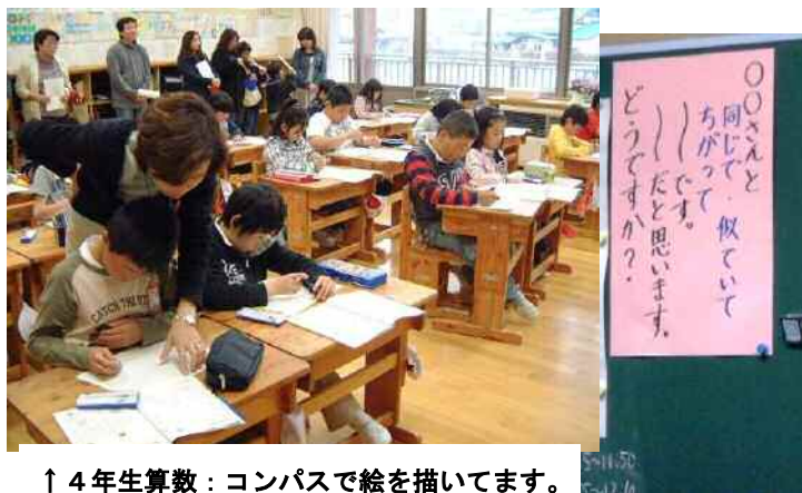
↑ 4年生算数：コンパスで絵を描いています。

午後の一時間でしたが、スタートした学校の様子を見ていただきました。新生入生、学級編成を替えの他、同じメンバーでもどのクラスも新たな気持ちでスタートしていたかと思えます。「落ち着いて学習」はもちろん「伝えあう学習」めざして、発表のルールを掲示したり、子どもたちが学習のめあてを決めている学級もありました。次回は6月5日です。