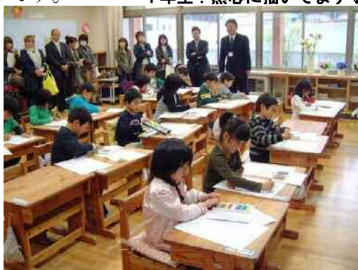
1年生：熱心に描いています↓