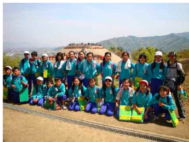
六年生：遠足ラッシュで森將軍塚古墳登頂を待ちました。