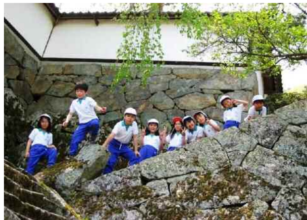
二年生：大雲寺で お参りの後は、色オニが大流行