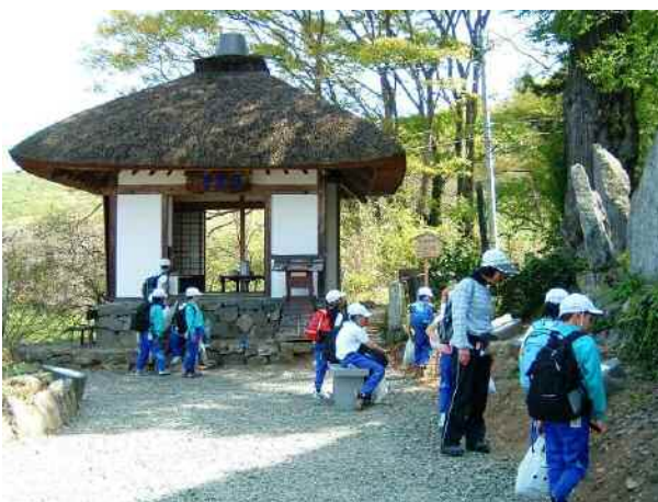
四年生：長楽寺にて。帰り道でも元気です。