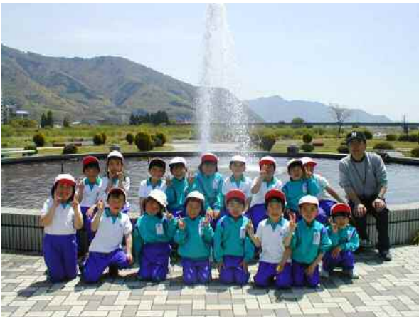
一年生：親水公園で 水がうれしい暑さ