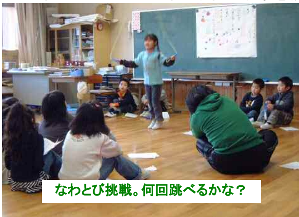
なわとび挑戦。何回跳べるかな？