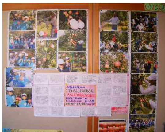
かむりきタイムの「リンゴ学習」では、お礼の手紙 や学習をまとめた「リンゴ新聞」を展示しました。