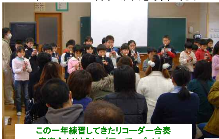
この一年練習してきたリコーダー合奏 音楽会よりさらにパワーアップです。

★ 3年生 ★ 3年間の成長を写真で見ながら合奏発表。漢字クイズは難問！でした。