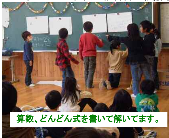
算数、どんどん式を書いて解いています。