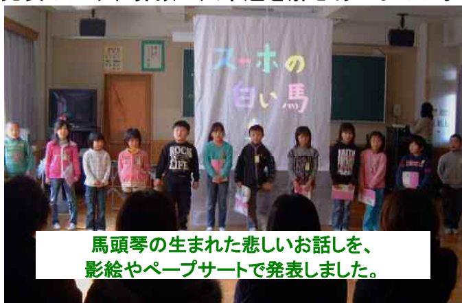
馬頭琴の生まれた悲しいお話を、 影絵やペープサートで発表しました。

★ 3年生 ★ 3年間の成長を写真で見ながら合奏発表。漢字クイズは難問！でした。