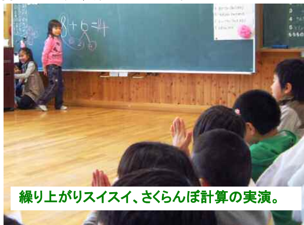
繰り上がリスイスイ、さくらんぼ計算の実演。