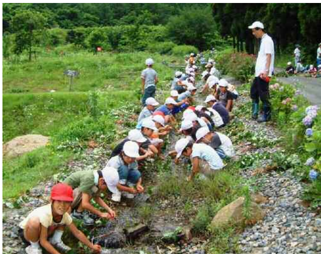
薬草(ドクダミ)採り 3年