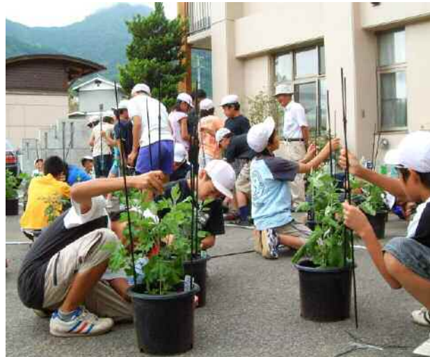
菊作りの支柱立て 6年

更級の里友の会のみなさん、体験館の方々のご指導で畑の草取りの後、3年生は「縄文まつり」に使うドクダミ採りにマレットパークの山へ出かけました。山の中には大きな株がたくさんあり大収穫、蒸し暑い中、冷たい清流で薬草を洗うのは楽しみの様子でした。