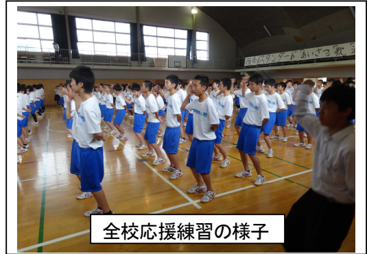
全校応援練習の様子

いよいよ明日から多くの運動部では更埴大会をむかえます。2年生という立場上、試合に出場する人もいれば3年生をサポートする人などそれぞれ役割があると思います。学年としても、ここ2週間、体育応援委員が中心となって、途中からルーム長会も加わり応援練習をしてきました。2年生の応援が3年生に届き、ぜひよい結果を残してもらいたいと思います。