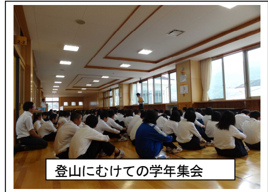
登山にむけての学年集会

今日、6時間目の学活で、登山についてやりました。山に登るときの注意点や持ち物の確認をしました。登山はだんだん近づいてきています。注意点などをしっかりきいてすばらしいものにしたいです。