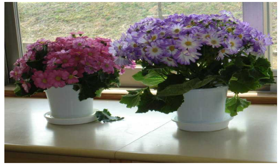
【教室に飾られた鉢花】

入学式を終え、翌週には生徒会対面式と生徒会入会式、そして生徒会説明会がありました。入会式では各クラスからの代表生徒3名が生徒会役員より、「生徒会入会証」と「生徒会用ノート」、更には教室環境を整えるための「鉢花」をいただきました。生徒会ノートは、昨日の第1回委員会から使用させてもらいました。これからの1年間、日常的な活動をしたり、いろいろな行事を企画したりすることを通して生徒会活動を行うことで一日も早く、「更埴中学校の一員」になりましょう。