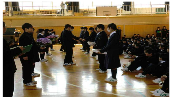
【鉢花と生徒会用ノートを受け取る生徒】