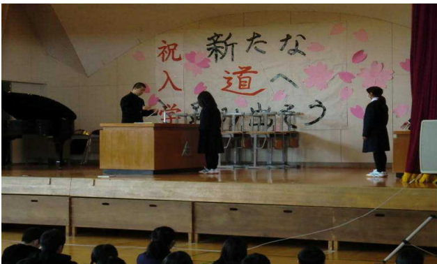
【入会証を受け取る生徒】