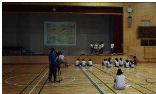
「私たちの町 上山田」練習風景