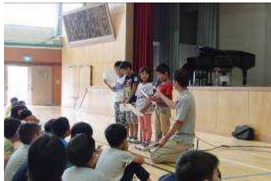
始業式 児童の発表

夏休みには、先生方は、自己研鑽のための職員研修会を行いました。夏休み初日の7月27日（木）には、地域の遺跡等を巡る地域巡検、