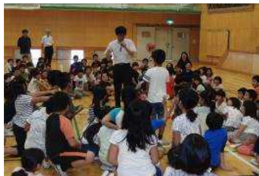
始業式 校長先生のお話