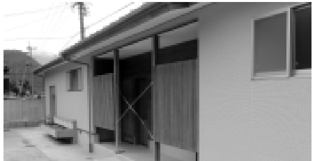
新しくなった更衣室やトイレ(プール)