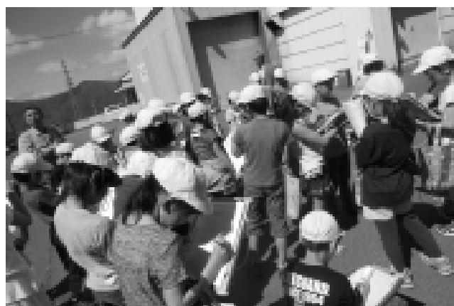
真剣にメモをとる子どもたち(社会科見学)

9日(金)には、4年生が社会科見学に行きました。警察署、消防署、ゴミ焼却場、浄水場の見学をし、仕組み、役割、そこで働く人たちの努力と工夫などを学ぶとともに、環境を守ろうとする姿勢の素地を培ってきました。