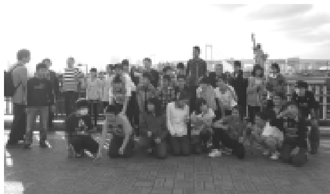
お台場にて(修学旅行)

6日(火)・7日(水)には、6年生が修学旅行に行きました。日本の政治・経済・文化・交通などについて見聞を広めたり、働く人たちの様子を実際に調べることで生きたキャリア教育を行ったりしてきました。