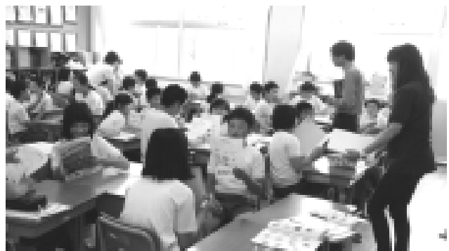
外国語活動の授業 I like ~