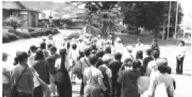
ポスター掲示活動 出発式