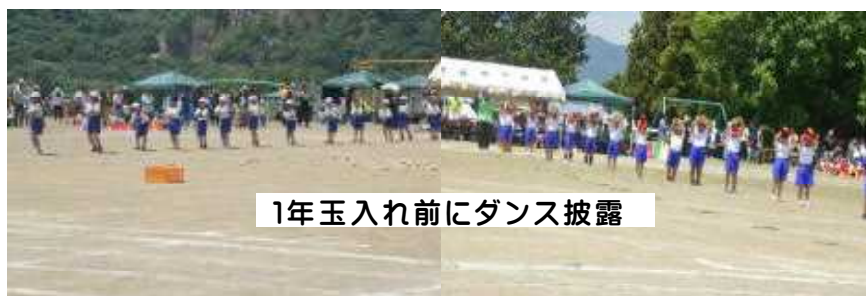
1年玉入れ前にダンス披露

夏を思わせる日差しの中でしたが、地域のご協力のおかげで児童席にテントを設置することができたため、厳しい暑さをしのぐことができました。また、大勢の声援を力に変えて、子どもたちが今までの学習の成果を発揮してがんばりました。