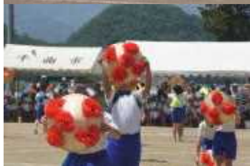
力強く踊りきった4年花笠