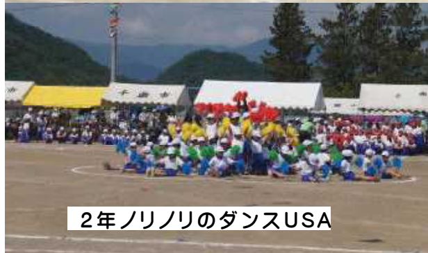
2年ノリノリのダンスUSA