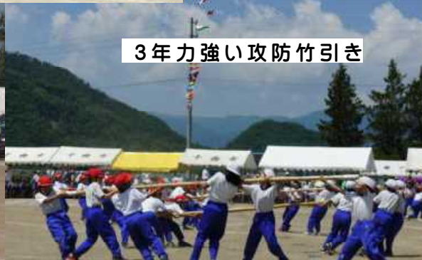
3年力強い攻防竹引き