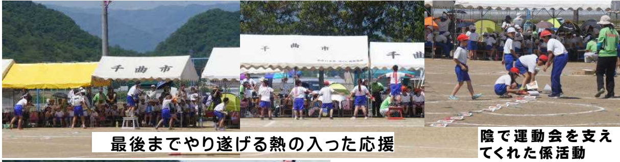
最後までやり遂げる熱の入った応援