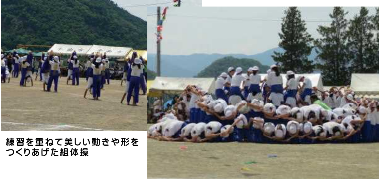
練習を重ねて美しい動きや形をつくりあげた組体操

各種目については、本当に見事にやり遂げた子どもたちでした。そして、係活動や応援も自ら動いてやっという姿がありました。3年生以上が競技や種目の準備のためにみんな出払っていたときに、2年生がリードして1～2年生だけでも一生懸命に応援する姿がありました。上の学年のみんなががんばっている姿を見て、自分たちだけでもやろうという思いが高まったようです。係の活動でも、気づいて動く姿が随所であり、とてもキビキビと動いて運動会を支えてくれました。素晴らしい姿をたくさん見ることができました。