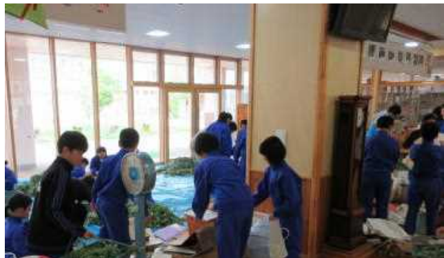
たくさんのヨモギが集まりました

今年は4月に何度も寒い日があって、植物の成長が例年のように伸びていないようでした。そうしたこともあって、遠くまでヨモギ摘みにいってくださったご家庭もいくつもあったようです。緑の少年団からもお礼状でお伝えしたように、今年は 432Kg となりました。およそ、26,000円をいただけるそうで、児童会の活動費に充てさせていただきます。ご協力ありがとうございました。