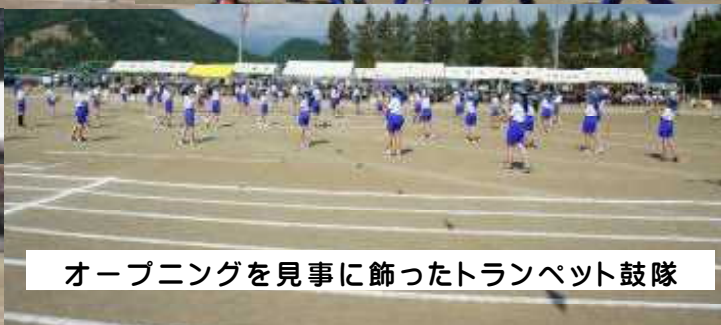
オープニングを見事に飾ったトランペット鼓隊

どの学年もこれまでの練習の積み重ねがしっかりと生かされ、のびのびと力強く演じたり、競技したりすることができました。