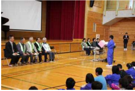
見守り隊のみなさんに感謝の思いを