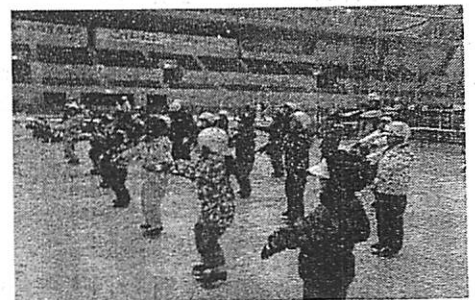
陸上トレーニング中

2年生は、中のリンクで歩くことから始めました。手を前に突き出し、一歩ずつバランスをとりながら歩きました。反対側へ行くまでを3回に分けて少しずつ進み、それを1往復半ほどやるといよいよ外リンクへ出ることになりました。こんなによちよちした状態で大丈夫なのかちょっと心配しましたが、1周してくる頃には、一歩ずつがかなり安定してきていました。そして2周もしてくる頃には、すっかりスケートを楽しみだしている子どもたちでした。