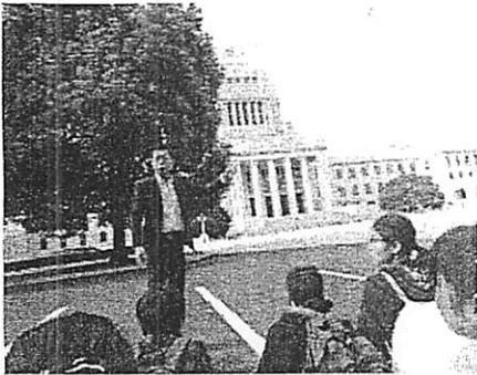
議員さんからの国会のお話

11月20日～21日の1泊2日で6年生が東京への修学旅行に行ってきました。屋代高校前駅に6時前から続々と集まり、あっという間に全員がそろい、6時15分頃には出発の会を行いました。前日の会では3つ【ま】についての話がありました。 ①まなぶ ②まもる ③マナーよく という3つをみんな確認したことがしっかりと位置付いていることを感じました。