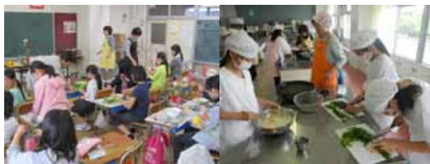
地域の皆さんから学ぶ (クラブ活動)