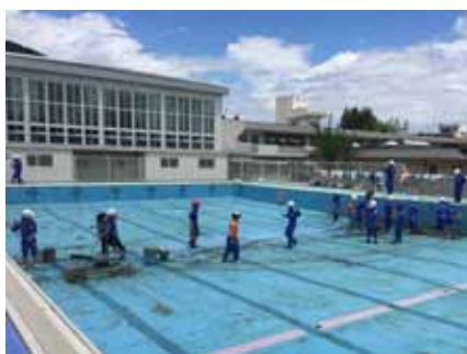
4,5,6年の皆さんにプールそうじをしてもらいました

学年が連携して作業できたプール清掃でした。全員が無事に水泳シーズンを終えることを祈念して、26日にプール開きを行いました。