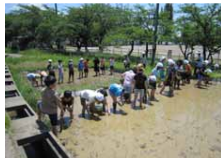
自分たちの手で植えました

これからが稲作りも本格的になります。どのように活動していくのか、いろいろな方に聞きながら進めていくと思います。困難が多いほど、出来上がったものに対する思いは格別です。自分たちを信じて取り組みましょう。