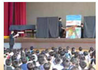
物語をお聞きする (全校読み聞かせの会)