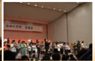
金管・アップルスティック