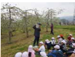
農業体験 (3年生摘花作業)