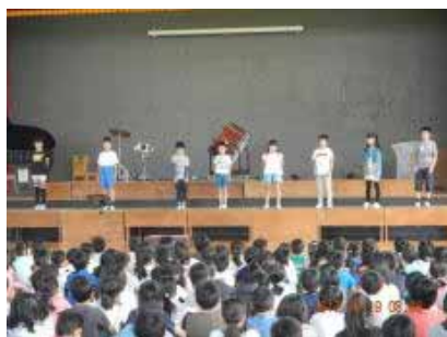
「さあ はじめよう」 音楽会の呼びかけ練習

発表の中で、寸劇も行ってくれました。 相手に伝えるためには何が大切かを1回1回の発表を通して体得してほしい と思います。