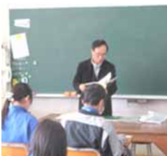
ふるさとを学ぶ (6年生語り部のお話)