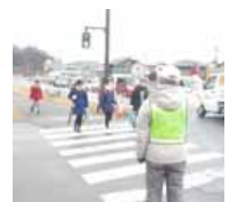
登下校のふれあい (見守り隊)