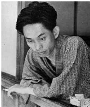
川端 康成 1938年(39歳頃)、鎌倉二階堂 の自宅窓辺で

いよいよ2017年が始まります。みなさんにとって、新しい始まりの日になりますように！