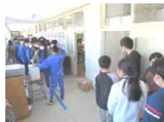
放送による立ち会い演説会後の投票風景(6年)