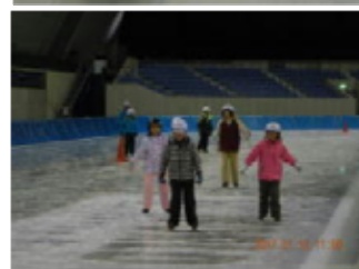
スケート教室(2, 3年生)