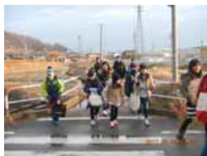
元気に登校明るい挨拶！