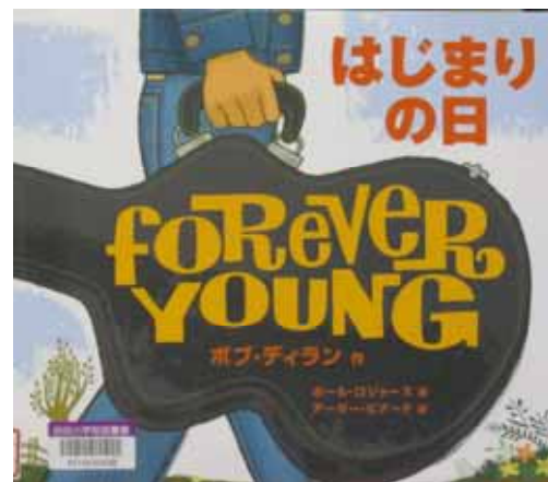
はじまりの日 ボブ・ディラン 作 ポール・ロジャース 絵 アーサー・ピナード 訳 岩崎書店

いよいよ2017年が始まります。みなさんにとって、新しい始まりの日になりますように！ 以上でお話を終わります。