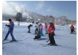
スキー教室(4, 5, 6年生)