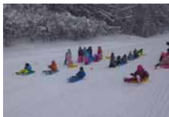
そりの滑り方を教わって順番に滑っていきます！

ドを作って、ライブ活動(演奏)を始めました。いろいろなジャンルの音楽を取り入れて、自分ならではの音楽を創り上げています。現在は75歳です。