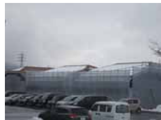
建設が進む「恵愛学園」

保護者の皆様には、もう一度上記の視点について振り返っていただき、ご理解とご協力をお願いします。