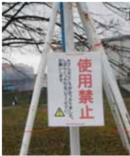
使用禁止遊具の表示です

なお、修理等につきましては、千曲市教育委員会とも相談の上、随時着手していく予定ですので、ご承知おきください。