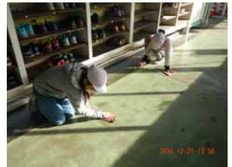
一心に床を磨いています