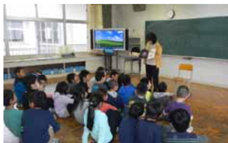
先生方による読み聞かせ会（読書旬間）

みなさんが毎日コツコツと取り組んでいたことの一つとして、図書館の利用があります。