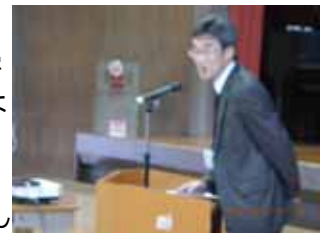
2学期終業式校長より

先生は、いろいろな場面で、目標をもって挑戦している皆さんの姿を見ることができました。それは、運動会や、マラソン大会、なかよしパークなど、行事の中で見ることはできました。