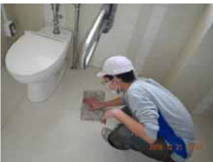
窓を開けて、腕まくりをしてトイレの床を丁寧に磨いています