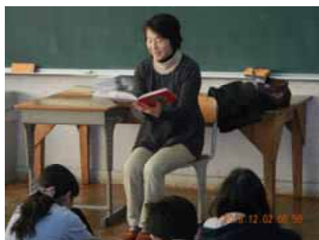
四季の会の皆さんによる読み聞かせ