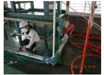
ふだん目につかない廊下の隅にかたまったほこりを丁寧に雑巾でとっていました。