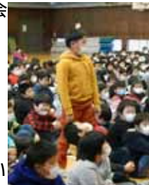
質問の答えに対して理由を説明するお友達

2016年も終わろうとしています。今年は熊本地震や、糸魚川市の大規模火災など、さまざまな天災や人災に見舞われた年でした。