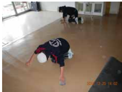
職員玄関を力強く雑巾で拭いています