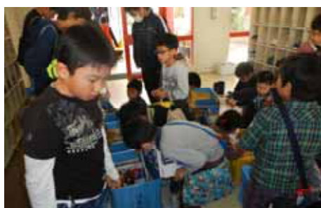
みどり号訪問 たくさん子どもたちが、玄関に集まります！