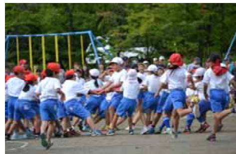
バンブータイフーン