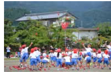
Let's 玉入れ ラッキーチャンスをつかみ取れ！