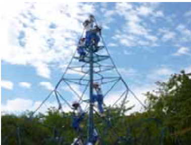
中央公園遊具で遊ぶ(1年)