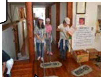
感謝の気持ちを込めてびかびかに！