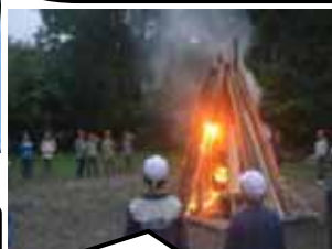
待ちに待ったキャンプファイヤー、汗びしょりで踊ったダンス