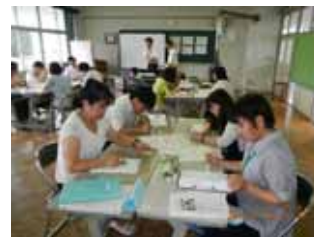
授業研究会小グループでの意見交換