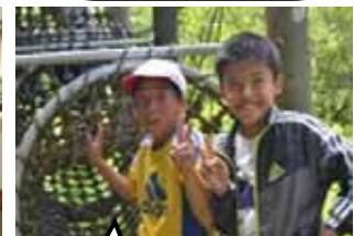
フィールドアスレチックで締めくくり