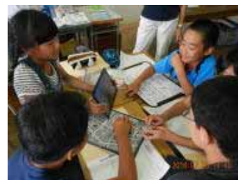
撮ってきた写真を見ながら意見交換

7月25日(月)に、授業を公開しました。子どもたちは、何回か調査に出かけ、その中で出てきた疑問「どうして古い建物なのに壊さなかったのだろう」について、班ごとに自分の考えを発表し、その価値について話し合いました。