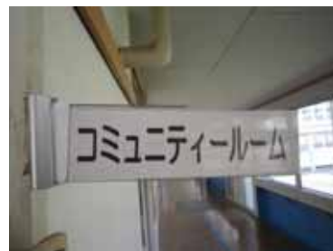
低学年校舎に準備してある、 コミュニティルーム