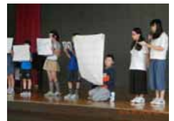
代表委員会の発表