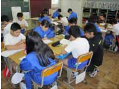
宿題の見直し(週3回) 学年や宿題によって、グループ毎 や個人、先生による一斉見直し等 様々です。

本年度、治田小学校では、下記の点を重点 にして、取り組んでまいります。保護者の皆 様のご理解とご協力をお願いいたします。(詳 しくは学校要覧及びホームページ掲載のグラ ンドデザインをご覧ください)