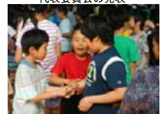
何人と挨拶出来たかな？