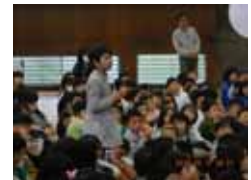
感想を発表するAさん