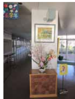
定期的に花を活着ていただき、 環境を整えてくださっています