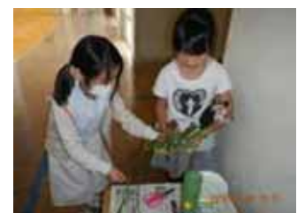
フラワーアレンジメントクラブ

学年の枠を超えた活動です。お互いを理解し、協力すべき時には、学年を超えて自然にできるようになっていくことを期待します。