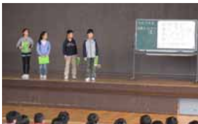
平成28年度児童会スローガン発表 (児童集会で)