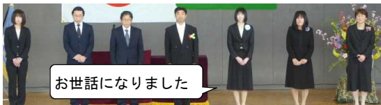
お世話になりました

4月6日(木)の午前に入学式と1学期の始業式が行われました。新しい先生や教室、教科書など、ドキドキの一日でした。児童の明るい声と目の輝きに、みんなで学び、行事などできることに感謝しながら、新しい1年間をいい年にしたいと思います。