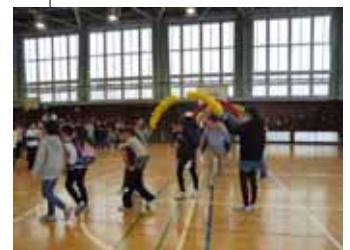
6年生のおんぶで1年生は入場しました