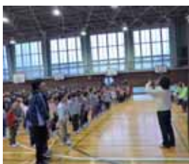
「ありがとうの花」を全校で歌いました。

「守り隊のみなさんは、朝の挨拶で明るい気持ちにしてくれます。あるいている私たちの背中を元気の挨拶で押して下さい。ぼくたちも大きな声で挨拶をしたいです。これからもあたたかく見守ってください。」 (児童会長のお礼の言葉)