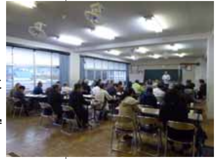
治田の子どもを守る会 PTA会長の司会で会がすすみました。活発な話し合いとなりました。

「自転車に乗れば車と同じです。そしてひいて歩けば歩行者と同じです」忘れないでください。