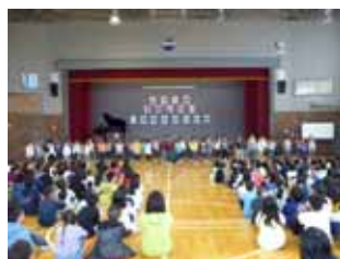
1年生の発表堂々として明るい発表でした