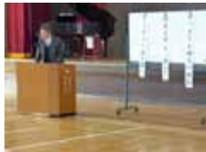
1学期始業式 校長の話

Q 「校歌」と「子どもの歌」ではどちらが先に作られたのでしょうか？... (答えはお子さんに聞いてください)