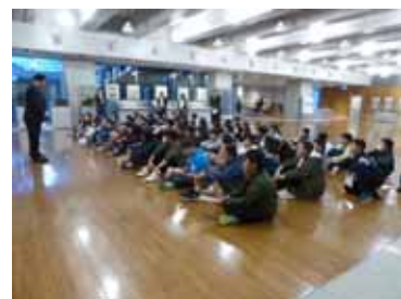
国会議員のお話を熱心に聞く

2日目の最後は国会議事堂でした。今までの場所とはちがって,日本の政治の中枢の見学です。ディズニーランドのあとの見学でしたので,けじめがつけられるか心配でした。やはり国会議事堂に入る前に添乗員さんから注意を受けました。きっと担任の先生から言われたことをその注意で思い出したのでしょうか,議事堂内では話を聞く姿勢,行動など本当にきちんとしていました。