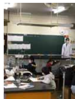
3年2組の算数の授業(右),4年1組の理科の授業(左)