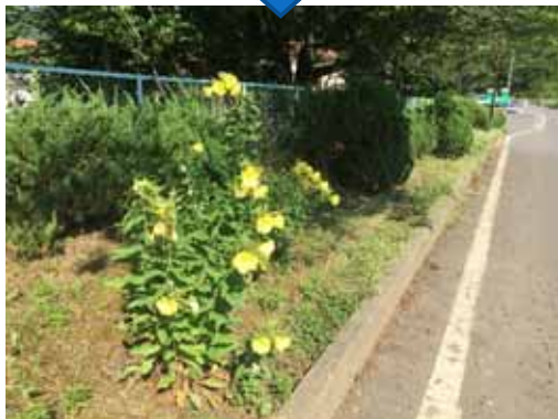
2株大きな大待宵草に成長しました (2018年6月22日の様子)