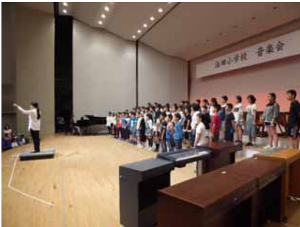
二部合唱「さようなら、音楽会最後、心を一つにした合唱でした

音楽会では、どの学年の先生方も子どもたちが生き生き発表できるにはどうしたらよいかを練習の度に考えそして修正しながらのぞみました。