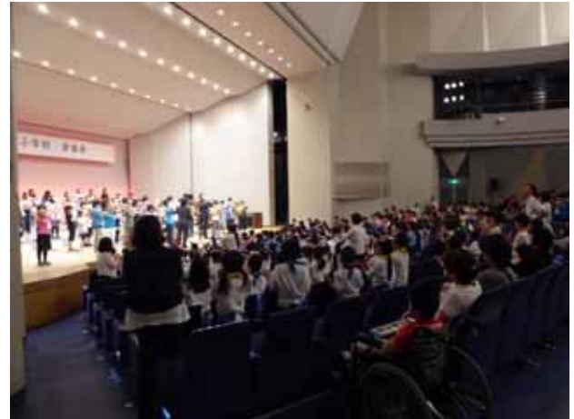
「アップルスティック2018」全校が一つになった演奏でした！

合奏で、どうしてもパーカッションの音が大きくなってしまいました。演奏している子どもたちはステージにいと、意外とパーカッションの音が聞きとりにくいのです。大きな音で打たれるリズムは、ステージにいる子どもたちにとって、自分が演奏するための大事な