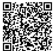
千曲坂城クラブ 賛助会員について

現在、クラブの運営は、加入者の年会費と千曲市・坂城町からの補助金で賄っておりますが、持続的な活動を実現していくため、地域のみなさまからの財政的なご支援をお願いしております。右QRコードからお進みいただき、ご協力いただける方は、事務局(千曲市教育委員会教育総務課内 Tel026-273-1111代表)または、埴生中教頭(Tel026-272-0015)までご連絡ください。申込用紙は学校にも用意しております。保護者のみなさまもご協力をお願い致します。