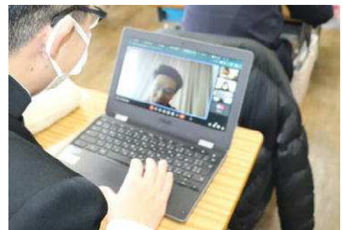
オンライン学活の様子(1/16)

本年度、本校では各学期に1回ずつオンラインによる学級活動を実施しました。1学期と2学期は、生徒が家庭から、クロームブック(タブレット端末)を使用してクラスごとに学級活動に参加するという形態で実施しましたが、3回目となる3学期は、生徒が教室にいて、担任が別会場からオンラインで学級活動に参加する形態としました。今年度計画したオンライン学活は、感染症の流行や非常災害時などに実施するオンラインの授業やミーティングに備えたものです。実際に、インフルエンザの流行により学級閉鎖となった学級では、スムーズにオンライン学活を実施することができました。ICT(Information and Communication Technology)の効果的な活用について、今後も検討を重ねていきたいと思ひます。