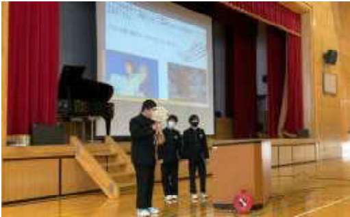
生徒による決意発表の様子(3学期始業式)

1月9日(火)に始業式を実施し、47日間の3学期がスタートしました。始業式では、プレゼンテーションソフトを用いたり、楽器の演奏をしたり、各学年代表生徒によるオリジナリティのある新年の決意発表がありました。これまでの自分の姿を振り返りながら、新たな1年間に向けた希望あふれる前向きな発表でした。学校長講話では、3学期のキーワードとして、「別れ」と「最善の準備」が示されました。3学期は様々な別れがあることから、新しい一歩を踏み出すための「ウェルビーイングな別れ」を意識し