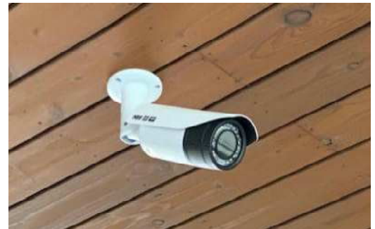
設置された防犯カメラ

3月末に、学校の警備強化のため、市教育委員会により、正面玄関前等の屋外に防犯カメラが設置されました。録画されたデータは、「千曲市立小中学校における防犯カメラの運用基準」に基づき、厳格に取り扱われていきます。また、警察等から録画データの提供要請がある際には、運用基準に基づきデータを提供する場合がありますので、ご承知おきください。