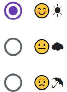
今の気分はどうか

本校では、2学期より、以前実施していた「健康観察」や「健康チェックカード」に代わり、生徒が各自でクロームブックを使って、心身の状況についてオンラインで入力する「ウェルビーイングチェック」を行っています。「今の体調はどうか」という健康状況の報告に加え、「今の気分はどうか」「もし何か相談したいことがある人は、先生を選んでください(プルダウン)」といった設問を加え、生徒の心身の状況を把握すると共に、悩み等がある場合の相談についても対応を考えています。このほかに定期的に学級担任と生徒との面談の実施にも取り組んでおりますが、心配なお子さんの様子等がありましたら、気軽に学校までご相談いただければと思います。