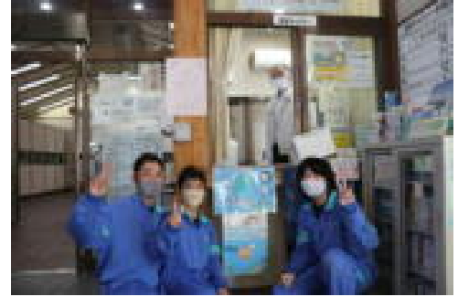
屋代駅市民ギャラリーへのポスター掲示

2年3組の環境グループの生徒たちは、きれいで暮らしやすい地域づくりに向けて、9月の一日総合で地域のゴミ拾いを行いました。そこで予想以上のゴミの多さに驚き、市役所の担当の方とお話をさせていただく中で、ゴミを捨てないように多くの人に呼びかけるポスターづくりに取り組み始めました。作成したポスターは、市役所2階や中央公園、屋代駅市民ギャラリーに掲示されます。生徒の願いが多くの人に届くことを願います。