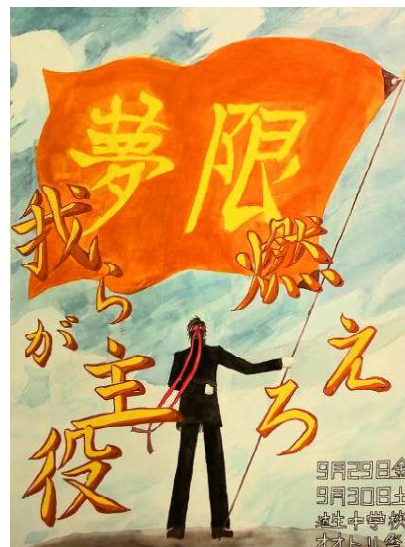
おおとり祭ポスター

前回の学校だよりでお知らせしたように、今年度のおおとり祭は、地域・保護者のみなさまの入場制限は、現在の所、予定しておりません。駐車場が不足することが予想されますので、自家用車でのご来校は、できるだけ控えていただければと思います。ご協力をお願いいたします。