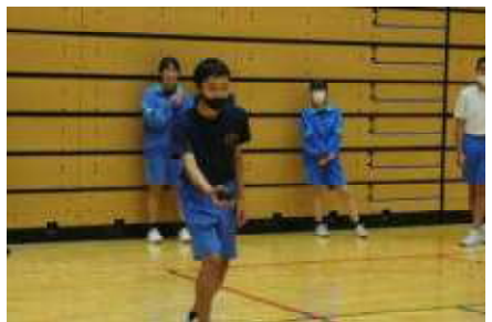
「ボッチャ」体験をする3年生

3年生は、地域への貢献をテーマにクラスごと活動を行いました。1組は、子育て支援の観点から中学校周辺の6カ所の保育園で、1日保育園児と過ごす保育体験をすることができました。2組は、県の学校安全総合支援事業を活用し、ICT機器を活用してオリジナルの防災マップづくりに取り組みました。3組は、令和10年(2028年)に開催予定の国民スポーツ大会(国体)および全国障害者スポーツ大会の理解を深めようと、ことぶきアリーナで「ボッチャ」の体験をしました。いずれのクラスも明確な目的意識をもった活動となっていました。