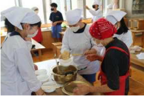
「おとうじ」づくりをする2年生

今年度、本校では自分たちが暮らす地域の人やもの、ことに学ぶ「ふるさと学習」を重点活動の一つとして取り組んでいます。左の写真は、2年生の家庭科の調理実習の様子です。地域のボランティアのみなさんにお越しいただき、郷土料理の「おとうじ」を調理しました。地域の方と関わりながら、楽しく、おいしい「おとうじ」を調理し、味わうことができました。このほかにも、家庭科のミシン指導、国語の書写指導や本の読み聞かせ、生徒会で集めているベルマークの分類、部活指導など、日常的に多くのみなさまにご協力をいただいております。みなさまのご協力のおかげで、子ども