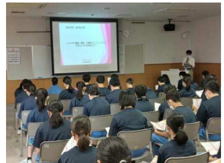
市役所の方のお話を聞く1年生

1年生は、1回目の1日総合で「便利で住みやすい地域」という埴生地区の良さを見つけることができました。2回目の1日総合では、埴生地区が住みやすい地域になっている理由について、町づくりの観点から、千曲市役所の各部署の担当の方をお呼びし、お話をお聞きしました。また、実際に地域に出かけ、地域の方からもお話を伺うことができました。自分たちが暮らす地域の良さについて再認識すると共に、駅前商店街の活性化などの課題についても知ることができました。市役所の方からは、市民ギャラリーの活用方法など生徒に向けての宿題も出されました。