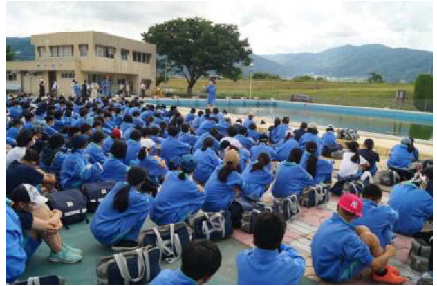
↑ 市民プール清掃 はじめの会の様子

市民プール清掃は、本校の伝統であると同時に、日頃からお世話になっている地域への貢献ができる貴重な機会でもあります。今後も大切な取り組みの一つとして位置づけていきたいと思えます。