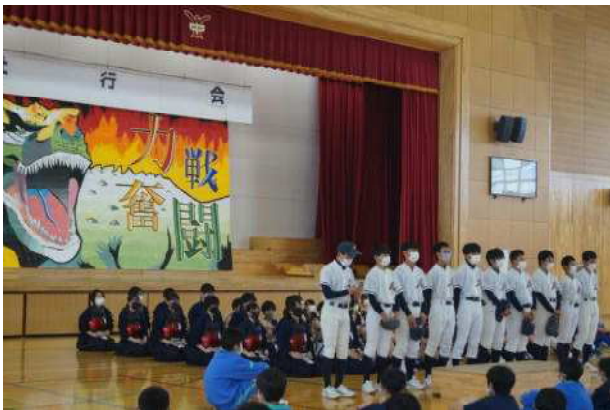
↑ ステージバック「力戦奮闘」は美術が制作

6月に入り、中学校体育連盟の北信大会が始まっています。北信大会は、6月初めから一ヶ月ほどかけて、各会場で種目ごと開催されます。これに合わせ、夏休みまでに3回に分けて壮行会を実施する予定です。6月3日(金)に実施した壮行会では、陸上、サッカー、男女バスケットボール、野球、女子バレーボール、剣道の各種目に出場する選手が、吹奏楽部の演奏に合わせ、ユニフォーム姿で入場し、決意表明を行いました。また、大会での健闘を祈って全校生徒によるあたたかい応援が行われました。各種目での埴生中学校生徒の活躍を期待したいと思います。なお、選手