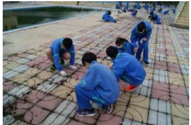
↑ 集中して作業に取り組む子どもたち