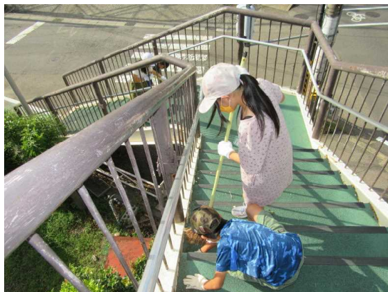
【児童会活動も本格的に始動！】

2ヶ月間の臨時休業がありましたが、お陰様で、どの学年も学習進度は十分挽回できる見通しがたちました。