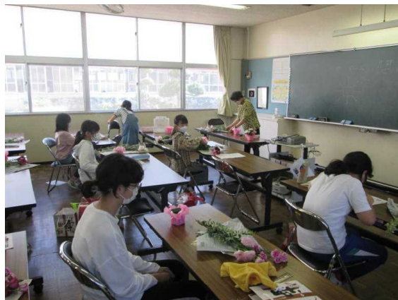
【クラブ活動も開始！】