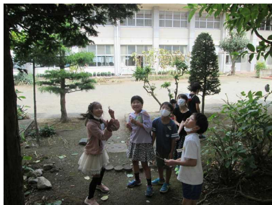
【「せみのぬけがらがあったよ」】

「校長先生、見てて！ これ、よく動くよ！ おもしろいよ！」 授業中、廊下では、理科の実験に 夢中になって取り組んでいます。