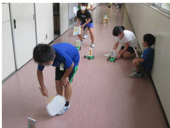
【廊下を使って理科の実験】