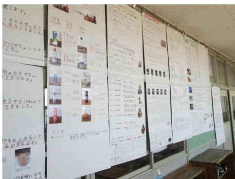
【カの入った研究物がズラリ】