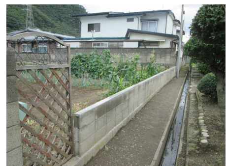
【新しくなったブロック塀】