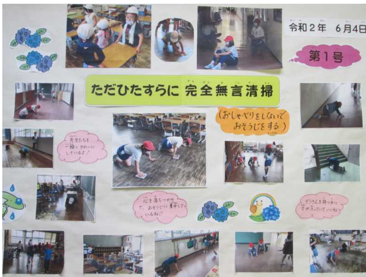
【「すてきな埴生っ子紹介」6月号】