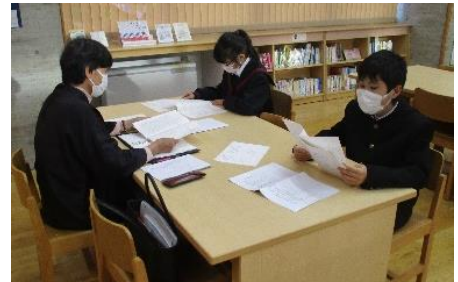
読み語りの会 読むのが好きな生徒が参加 年8回実施