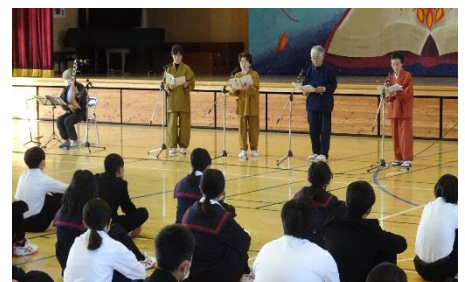
10/31 読書週間2 学年読み聞かせ会