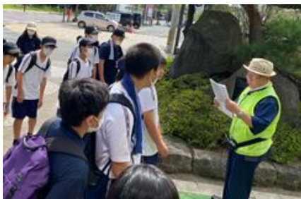
8/30 1学年地域散策で講師を依頼

学校だよりNO4で、本校のコミュニティースクール「チームつばさ」についてお伝えしました。この1年間、地域の方から支援をいただいたり、地域の方と交流したりと「チームつばさ」の活動をいろいろ行ってきました。プライドファイブの「地域に感謝」に関わる活動となり、支援いただいた地域の方々に感謝です。5月以降の活動を紹介します。