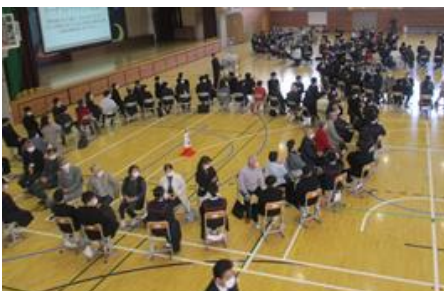
11/20 4年ぶりに開催した「トークフォークダンス」1年生と地域の方々と交流