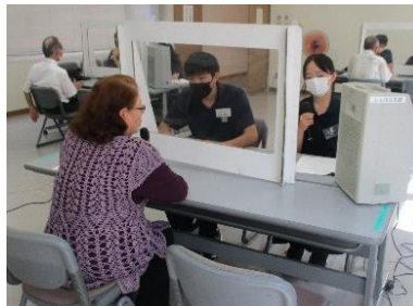
9/9 敬老の日インタビュー 生徒会役員参加